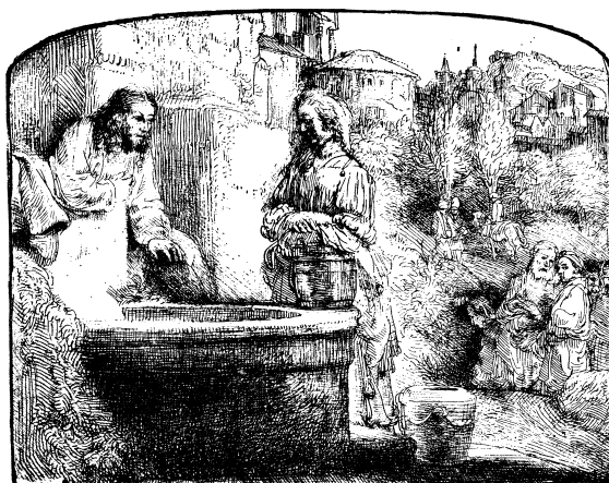
Jezus w rozmowie z Samarytanką Rembrandt van Rijn, akwaforta z 1654 roku.